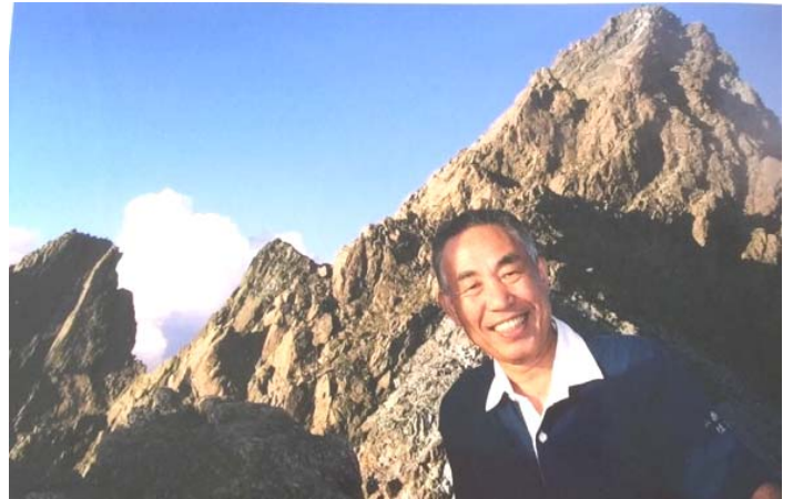
【槍ヶ岳をバックに】

今回、編集の担当者から原稿の催促を受け、急いで登山の準備をしどこに登ろうかと迷いました。火山噴火情報で地域の方々が大変心配なされた蔵王の規制も解除されたので、久しぶりに熊野岳頂上まで登ろうと支度をしましたが、前々日に急にお客様との打ち合わせが入り、次の日に予定を変更。しかしはなはだ残念ながら当日は台風の影響で朝から雨降り、とうとう原稿の締め切りに間に合いませんでした・・・。