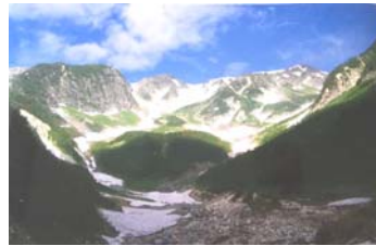
【北アルプス 穂高連峰】