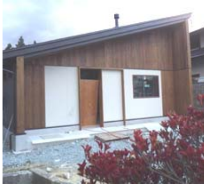
(ゲソ天1皿サービスです★)

オススメのメニューは肉そば・ざるそば・肉中華です。ご店主様が丁寧に作り上げたおそばの味は天下一品です。常連になること間違いなし！皆様のご来場をお待ちしております。