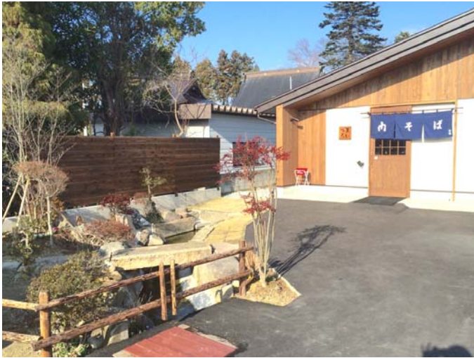
(外構工事施工：一松工業)